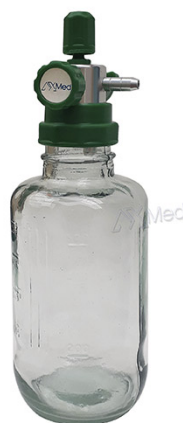
1602 - Aspirador tipo Venturi para Oxigênio