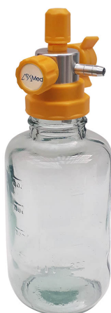
1603 - Aspirador tipo Venturi para Ar Comprimido