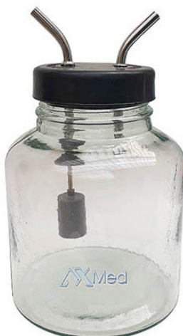
1700 - Aspirador com frasco de 03 Lts