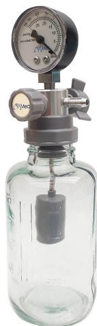
1601 - Aspirador para Vácuo - 500ml