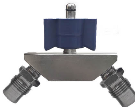
1402 - Tomada Dupla de Óxido Nitroso