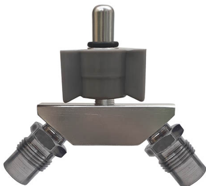
1403 - Tomada Dupla de Vácuo