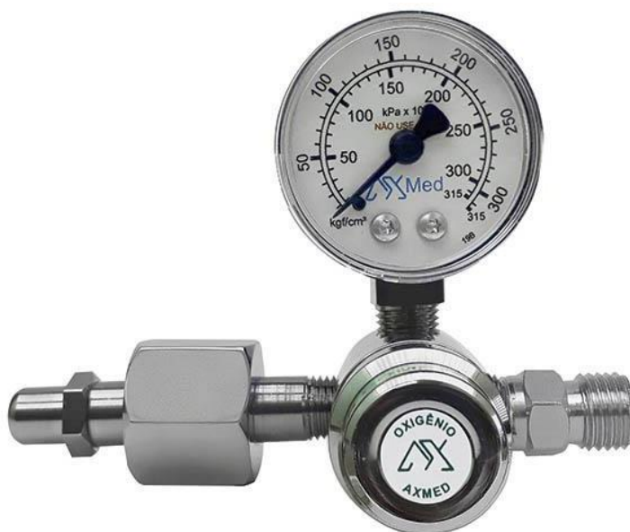
1200 - Válvula reguladora para cilindro de Oxigênio com 01 saída